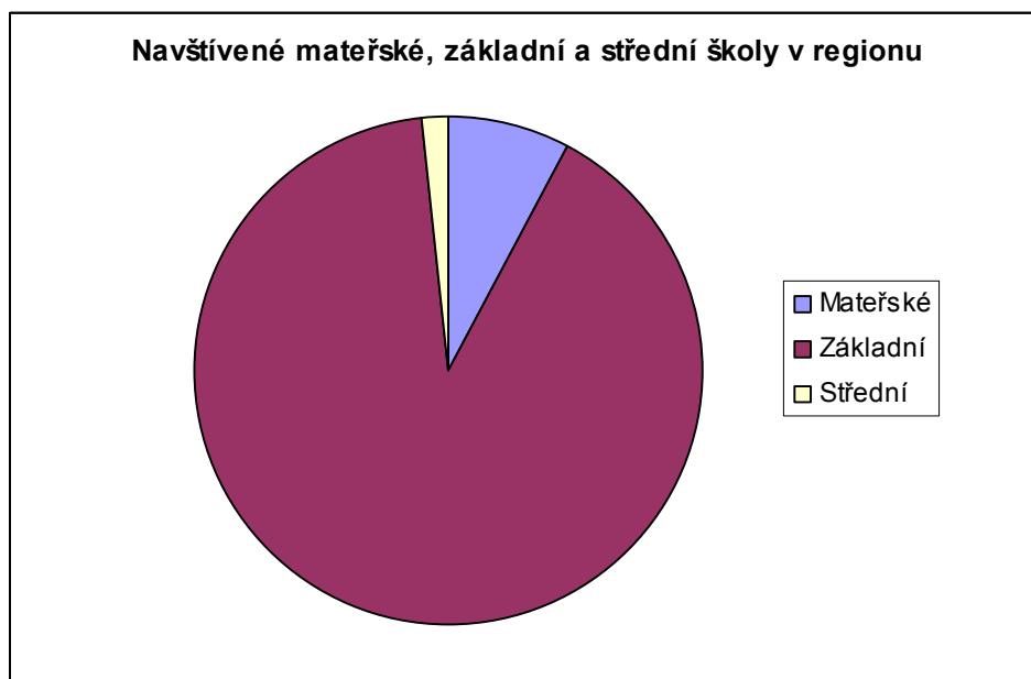
Graf č. 3 Navštívené mateřské, základní a střední školy v regionu