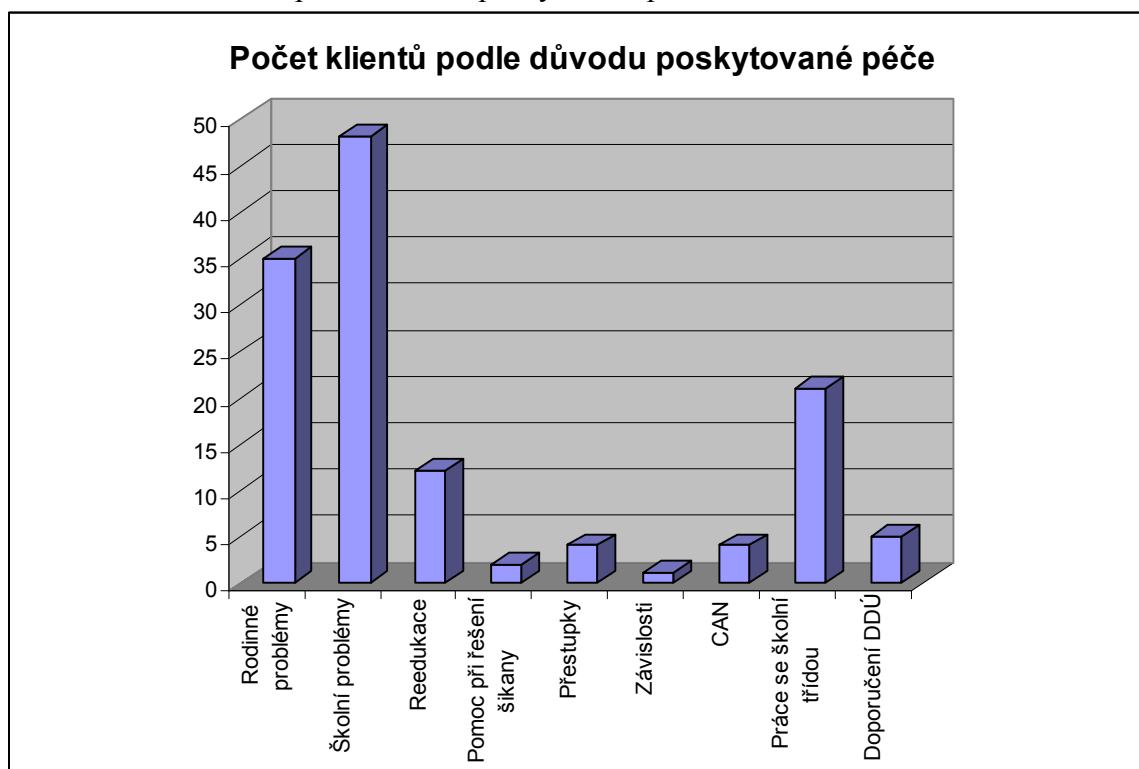
Graf č. 2 Počet klientů podle důvodu poskytované péče

Školní a rodinné problémy jsou zpravidla propojeny.